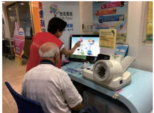
通譯人員服務新移民並給予關懷。