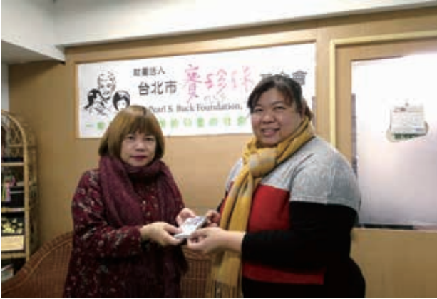
賽媽媽愛心捐贈，感謝基金會的陪伴。