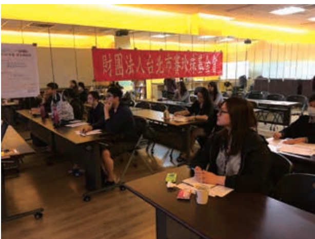
志工認真聽講師講課，更了解托育服務技巧。

為此，今年我們特別針對本會的在職志工夥伴開設培訓課程，主題方向設定為「托育服務技巧」，主因本會多數之新移民婦女需承擔照顧子女的責任，鮮少有機會可獲得喘息與自我成長學習的機會，為此，我們提供了婦女的支持活動及友善托育空間，而志工夥伴就會是我們不可或缺的一份子！培訓除了基本的兒少照顧概念以外，還要再更上一層樓，充實專業的知識以及態度，內容多元且富有意義，例如：與特殊兒童的溝通與陪伴、兒少分齡學習、營隊帶領與課輔、團體動力遊戲之運用等技巧安排，使其未來在服務過程能夠更加順利、上手，並且透過服務過程更理解、認同本會案家及服務。