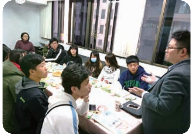
2月4日舉辦青少年座談暨高中大專頒獎。