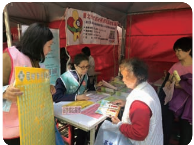
4月18日本會據點參與馬偕婦幼關懷月，辦理「展珍新-愛關懷」外展宣傳服務。