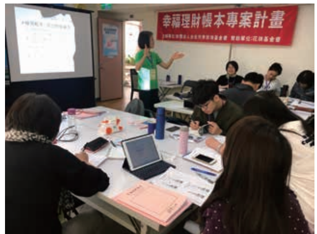
社工們都很用心吸收財金新知。

眼見社工紛紛結束培訓，帶著脫貧希望走入每戶家庭，而賽珍珠基金會也將成為他們身後最強大的後盾及支持，讓每一位社工都能成為改善家庭經濟的領航員，帶領服務對象改變理財觀念、改善家庭環境，與他們攜手走出經濟限制，看見自立的美好風景。