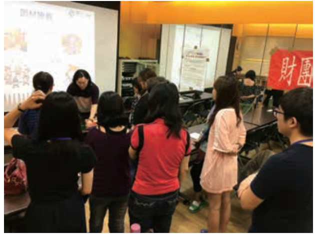
志工學習托育服務技巧，了解孩子的心理。

於培訓中，講師利用實際操作的方式，讓夥伴自行分組討論狀況劇並藉由集思廣益研究改善或應對策略，利用遊戲設計讓學員角色互換，真實感受若自己是孩子是否會喜歡、融入這項遊戲。課後，本會從志工培訓心得感想中亦汲取了許多正向回饋，例如：做志工除了陪伴孩子以外，同時要培育孩子；發現好多陪伴孩子的簡單素材；內容很棒、很有內涵，讓人理解很快等等，這對於往後如有開設相關訓練也都是給予寶貴的建議。此次培訓不僅止於志工本身受益，在此培訓中社工同仁亦受惠良多。