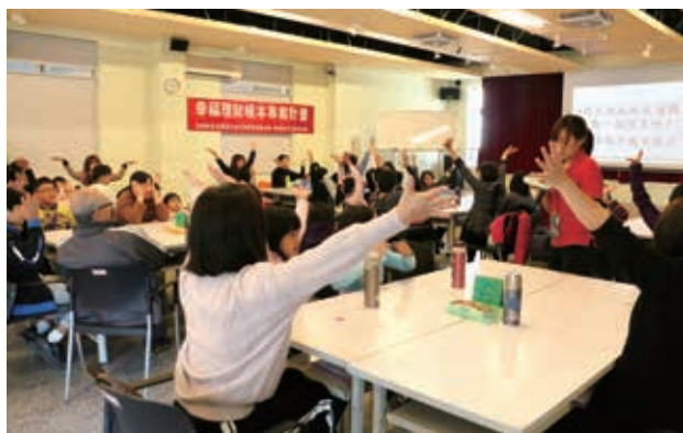
學員都踴躍舉手回答問題，融入課程中。

在親子理財種子營的尾聲，各組學員創立了運送公司，利用遊戲的進行認識簡易的投資觀念，有人選擇投資人力、有人選擇投資工具，動腦討論並嘗試不同的方法以增加運送公司的效率。最終老師分享，財富自由的秘密在於學會分配，除了建立儲蓄、支出的帳戶以外，也別忘了建立投資以及分享的帳戶，該活動於5月、7月將於其他縣市辦理，歡迎新住民親子踴躍報名，讓每一位孩子都能成為真正的小富翁。