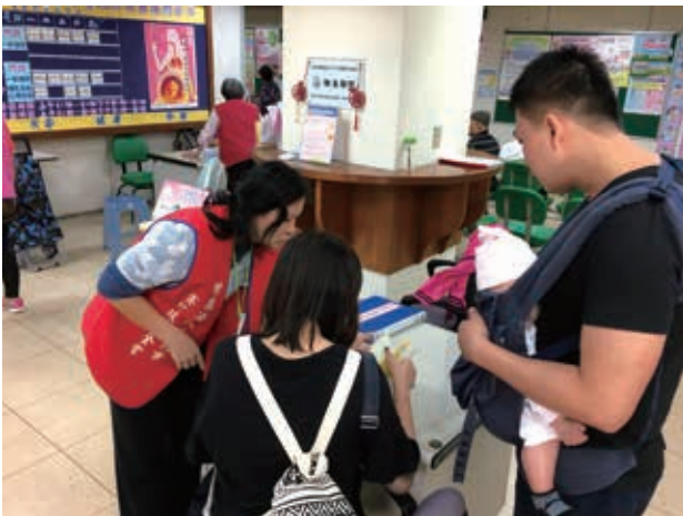
通譯人員陪伴孩子，也與家長共同成長。