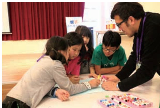
孩子與家長共同討論，一起成長。