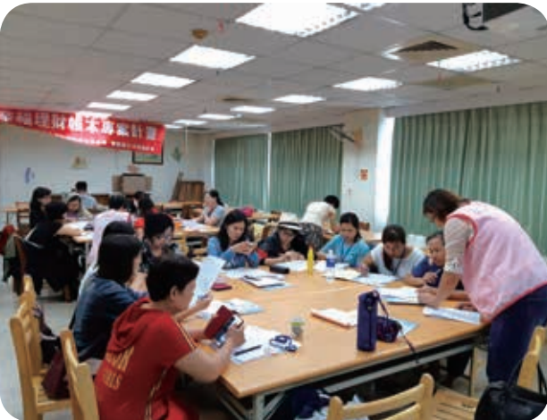
3月4日幸福理財帳本65期與高雄市立社會教育館合辦，和高雄姊妹一起理財生活。