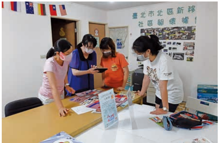
服務新移民過程中，常需邀請擅長多國語言的志工協助服務。