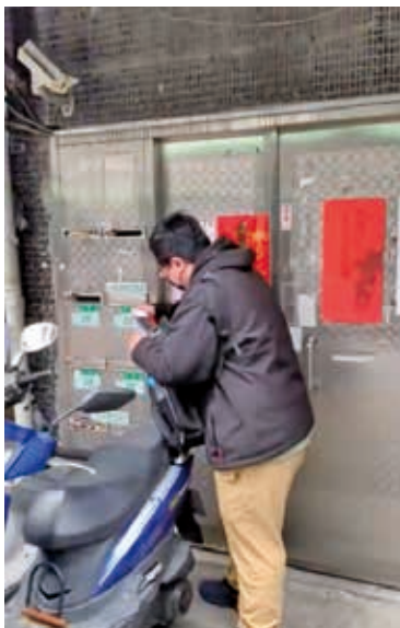
社工關懷訪視雖未遇，也會留下據點資訊讓服務家庭了解。

儘管新移民因為國籍、文化、語言、法規等在臺灣生活適應面臨許多挑戰，但透過據點社工的主動出擊，及時發現需求，幫助連結資源、解決問題，也希望讓新移民感受到臺灣的溫情。