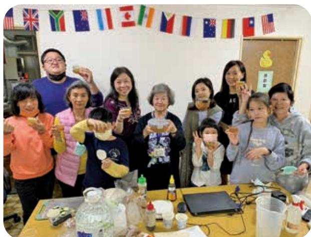
3/11 婦女節活動-「婆婆媽媽的廚房」，親子一起搓愛玉。