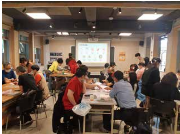
志工們非常投入在多元文化桌遊裡。

在這世上，有著一群熱心且願意無償付出的人，我們稱之為「志工」。賽珍珠基金會這一路走來，無論是大小型活動辦理、孩子們的學習陪伴，亦或是會內行政上的事務，都離不開志工們的相助。今年4月，基金會公開招募了今年度志工夥伴並於4月22號辦理志願服務特殊訓練課程，除了感謝舊有志工的長期服務和歡迎新進志工加入外，也希望能夠協助志工們申辦志願服務手冊，維護他們的權益。