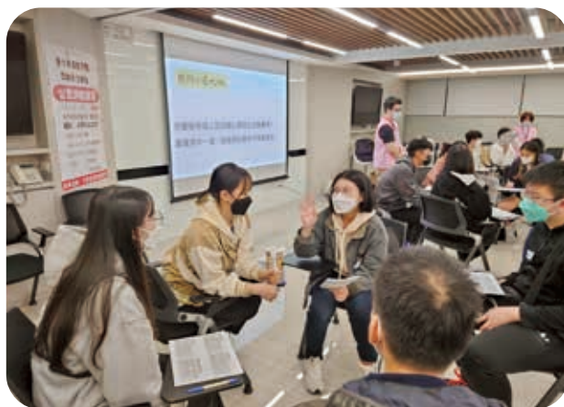
2/9「青少年座談會」學員互動交流，齊心完成講師提出的課題。