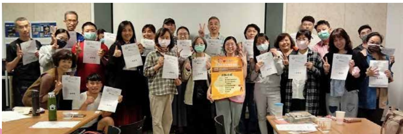
志願服務特殊訓練圓滿結束！志工全體大合照。