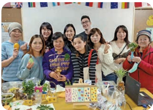
2/24「移居臺灣必修課-療癒系的種子盆栽」課程學員與成品大合照。