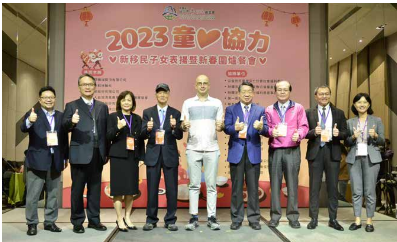
愛心大使吳鳳出席「2023童心協力-新移民子女表揚暨新春圍爐餐會」給予本會家庭勉勵，並與所有與會貴賓合影。