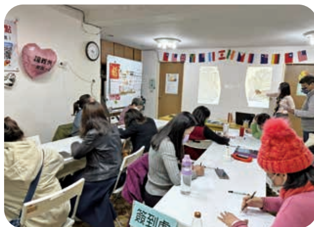
3/3 靜心紓壓禪繞畫_大家照著老師教導開始練習。