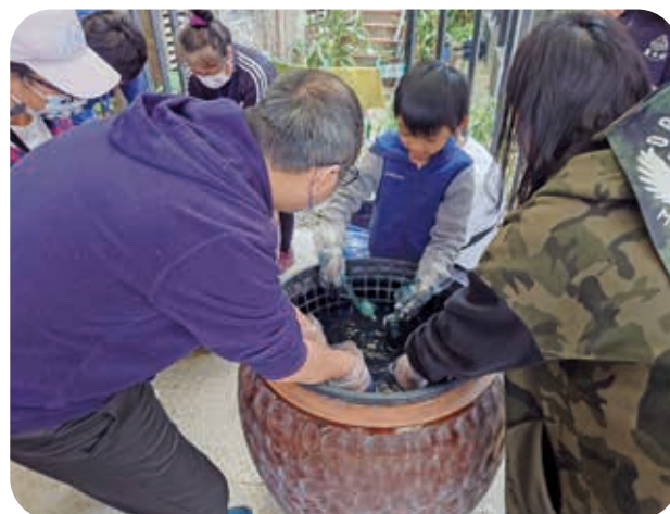
4/8 臺灣文化體驗-新移民親子在三峡體驗藍染製作過程。