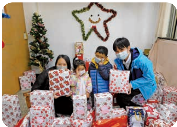
12/25 溫馨聖誕，孩童們抱著期待和興奮的心情收下禮物。