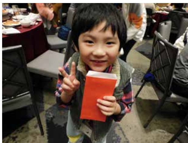
本會孩童開心領助學紅包！