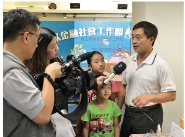
服務對象於記者會後接受採訪。

本會來年將繼續投注資源於金融社工項目，持續加強社會服務工作，希望讓大家看見理財教育著實是翻轉貧窮的一股助力。下一年度，我們希望能招募更多的合作夥伴與社工，持續將這樣有意義的理財培力課程更加發揚光大，翻轉更多家庭的未來！