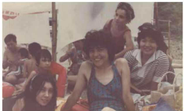
50年來，本會協助逾千跨國婚姻家庭的子女成長、自立。