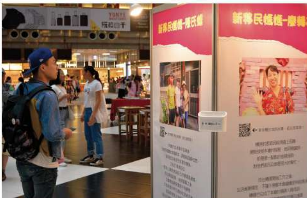
展覽吸引過路民眾們駐足欣賞。

「攜手同新一珍愛台灣新寶貝特展」是台灣首次以新移民子女及其家庭為主題的展覽，特別選在人來人往的台北車站大廳舉辦。位於交通樞紐的台北車站，匯聚了來自國內外的旅客，更能凸顯台灣為多元文化融合社會的特點。而四大展區「#啟程」、「#挑戰」、「#理解」、「#我們」更讓展覽跳脫靜態的欣賞模式，導入各式互動性展品。「如果我是新移民」、「猜猜我從哪裡來」、「標籤下的我們」等展品以寓教於樂的方式與大眾共同撕下心中的標籤，從中看見每位新移民及其子女都有獨一無二的外表、想法、天賦，共同繽紛了這片土地的樣貌。