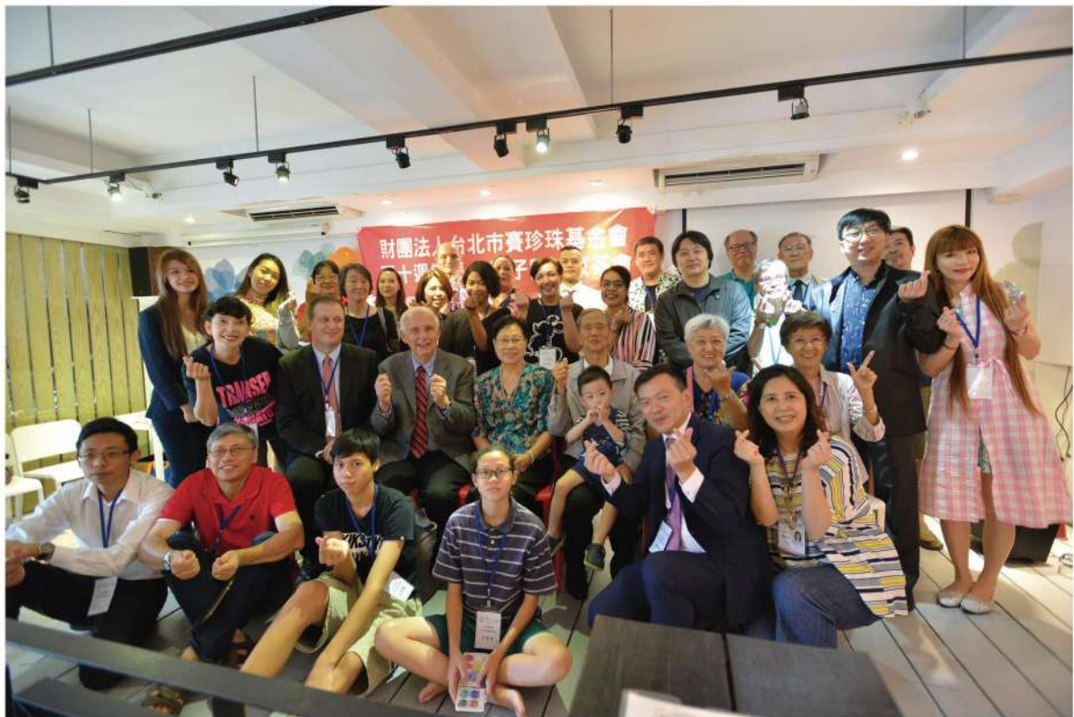
感謝當天所有參與活動的人員，在基金會50週年的日子與我們留下美好回憶。

賽珍珠基金會曾經陪伴過的孩子，永遠是我們的「大孩子」。數十年的光陰，讓我們都成長為社會中不可或缺的一份子，能在多年後與曾經陪伴過的孩子聚首，一起話當年、聊近況，分享彼此的生命故事，是基金會全體同仁最感到滿足與驕傲的時刻！