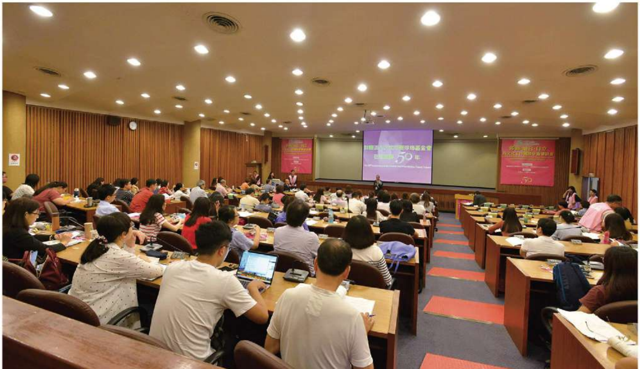
「移動·融合·自立~跨文化工作國際學術研討會」吸引逾百位學者、實務工作者與會。