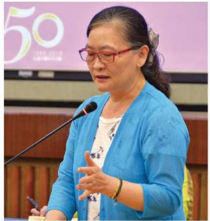
移民署移民事務組李臨鳳組長詳盡回應台灣移民制度及法規。