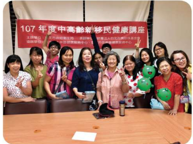
8月31日辦理中高齡新移民健康促進講座，深入淺出地帶領中高齡新移民認識日常保健與自我檢測。