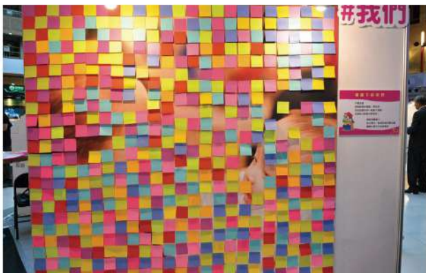
「標籤下的我們」盼社會與我們攜手撕下標籤，共造友善新社會。