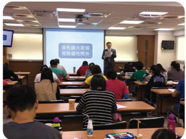
10月6日於桃園辦理公益理財講座，講師帶領大家做風險屬性問卷。