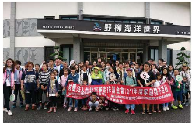
一年一度的一日遊活動，為寶珍珠家庭留下美好的回憶。