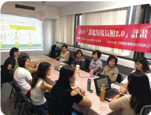
9月22日辦理衛生醫療通譯服務人員在職訓練暨團體督導。