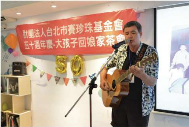
成為音樂人的大孩子在活動中自彈自唱，獻上美好的祝福。