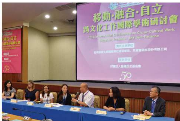
國內、外專家學者齊聚一堂，相互交流國外及台灣數十年的新移民服務經驗。

充實緊湊的一天，透過各項發表及交流，讓所有與會者深入瞭解移民在地化生活所面臨的各層面困境，得以探討突破各項困境之可能性與策略建議。我們真誠的期待藉由這場難得的交流，能成為台灣新移民服務前進的推動力，與大家一起檢視打造更為完善的移民制度，讓移民社會的台灣，成為新