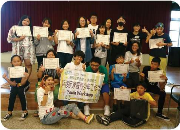
7月1日新移民家庭青少年工作坊結業式，在四天的課程後，學員們拿著結業證書大合照，劃下美好的句點。