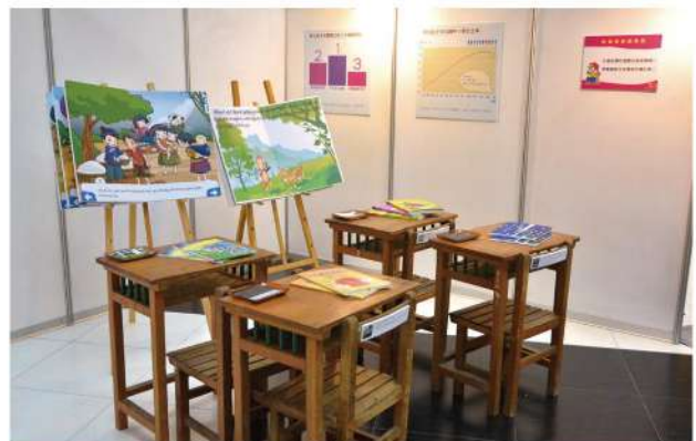
「如果我是新移民」寓教於樂的互動、情境式體驗讓民眾更能設身處地去了解在台新移民的現況。