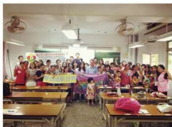
開心合影，為學習成長留下紀念。

學員們分別來自中國大陸、越南、印尼、泰國、緬甸、馬來西亞、印度，甚至有新移民二代，多元的組成讓整場活動宛如小型聯合國！一名