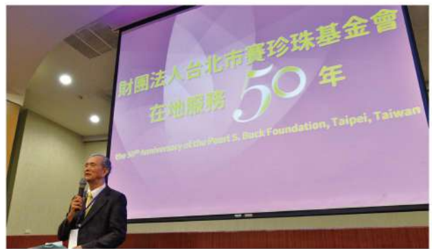
本會匯聚50年經驗，為新移民服務領域注入新的力量。

俗話說：「一個人走的快，一群人走的遠」，賽珍珠基金會能走過50年，絕非一人能夠完成。再次感謝這50年來與我們攜手相伴的每一個人，不管是認養人、捐款者、志工或是家庭與工作人員，因為有您，相信本會能站穩腳步，邁向下一個階段。