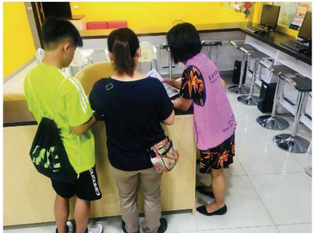
女香於南港新移民會館向方濟國中學生介紹新移民會館及臺北市政府新移民政策。