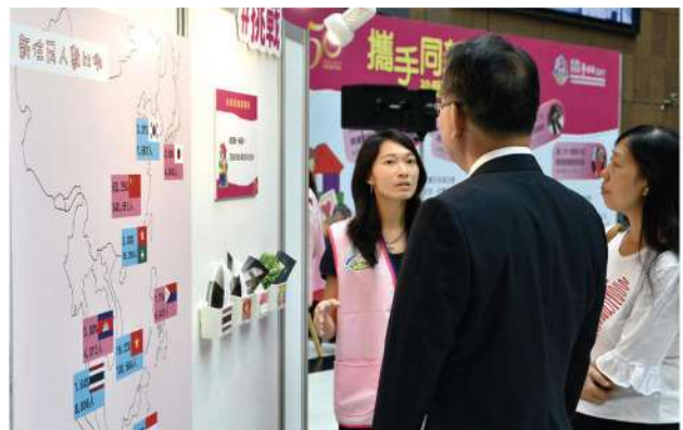
跟著工作人員導覽，理解展覽核心理念。