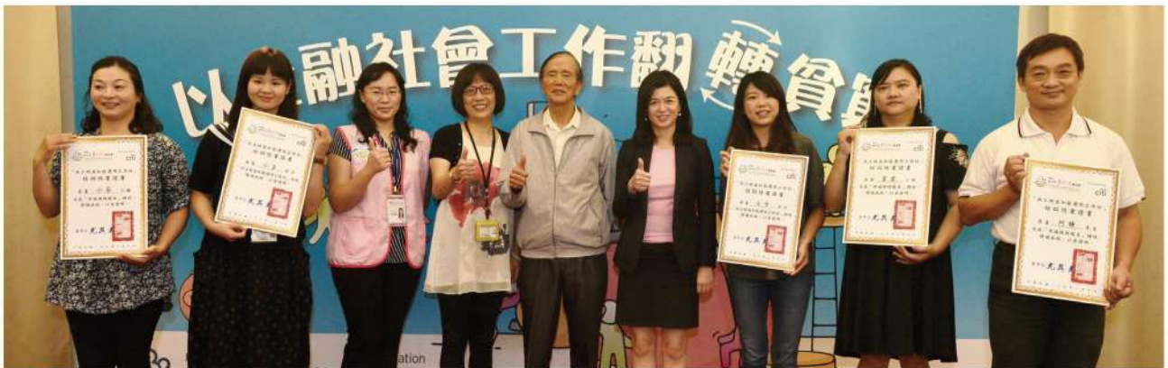
花旗公共事務長（右四）、桃園市政府社會局社工督導（左四）、本會董事長（右五）與副執行長（左三）和學員於「以金融社會工作翻轉貧窮」記者會合影。