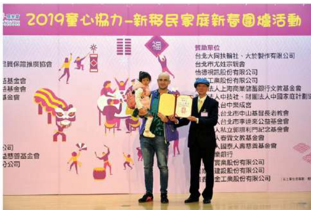
愛心大使吳鳳也和大家一起溫馨圍爐。

本會感謝並格外珍惜大家的愛心，將會持續公開、透明、妥善、誠信地使用這些資源，與大家一起提供清寒新移民子女穩定的經濟扶助、求學環境，讓萌芽破土而出的孩子，終有一天長成枝繁葉茂的大樹。