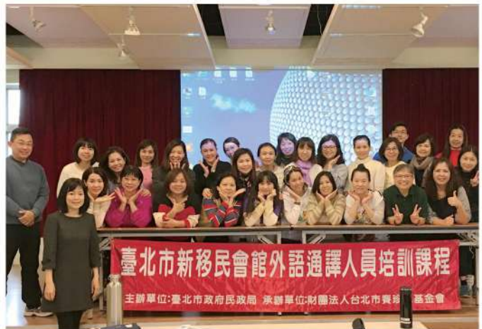
參與本次培訓課程的學員們。