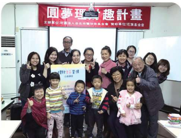
2019年1月20日與臺南市新住民關懷協會共同舉辦「理財好習慣講座」。