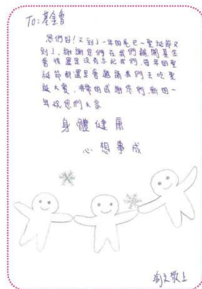
孩子們的感謝心聲。