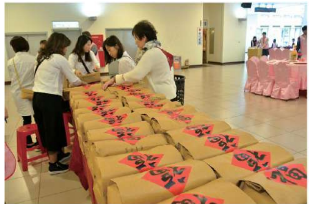
寶佳基金會贈送福袋給寶珍珠家庭。