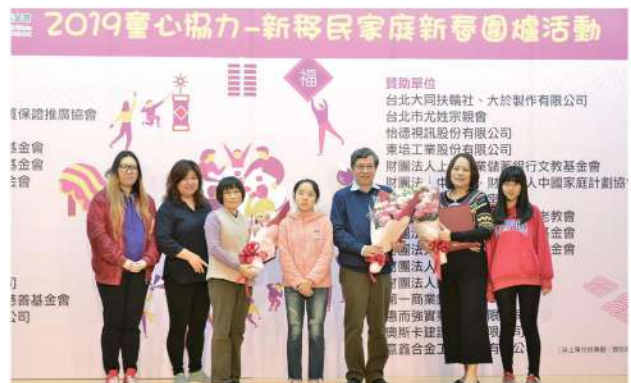
2月16日本會「童心協力」活動中，邀請3位資深認養人上台接受孩子們獻花感謝。