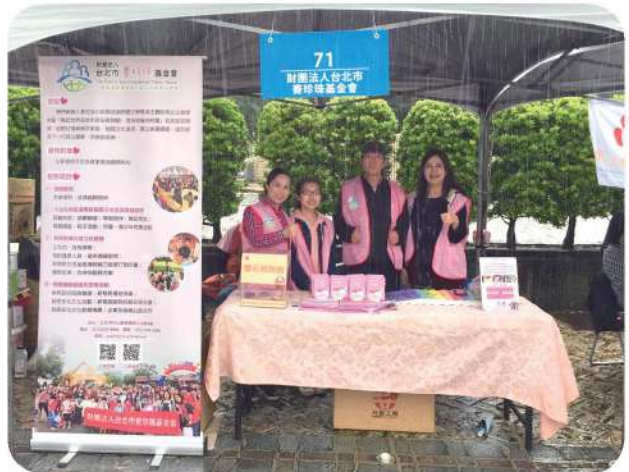
12月23日參與國際扶輪2018-19年度扶輪公益園遊會。