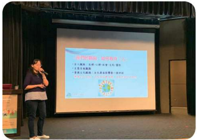
12月1日本會林蒞副執行長出席內政部移民署「新住民跨國文化適應政策論壇」。