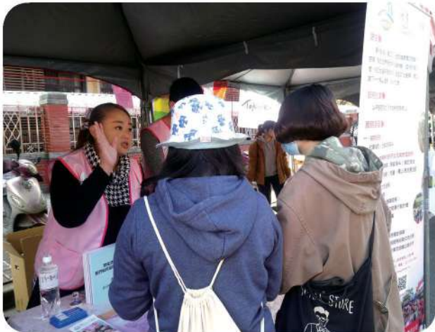
12月15日參與「2018人權市集」設攤。