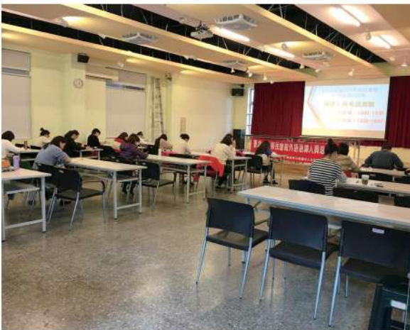
除了聽課，學員們還須通過測驗才能正式上線成為通譯人員。