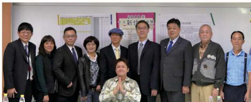
感謝各界評委協助「2018年十大新住民新聞」作業，讓活動圓滿落幕。