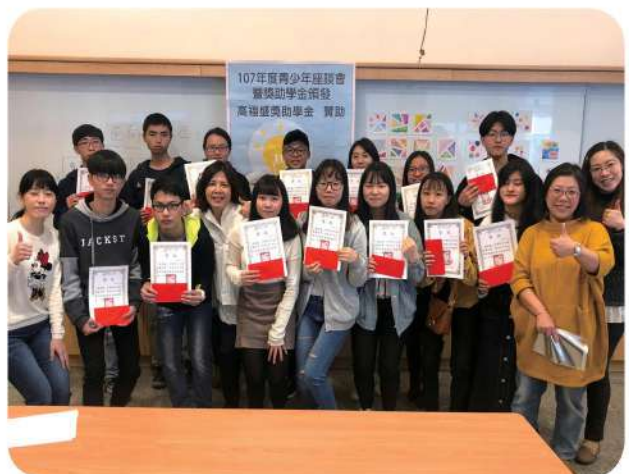
2019年1月30日辦理高中、大專組獎助學金頒發暨生涯發展職涯探索活動。