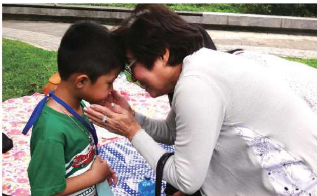
認養人是孩子的師長、親人，更是朋友。