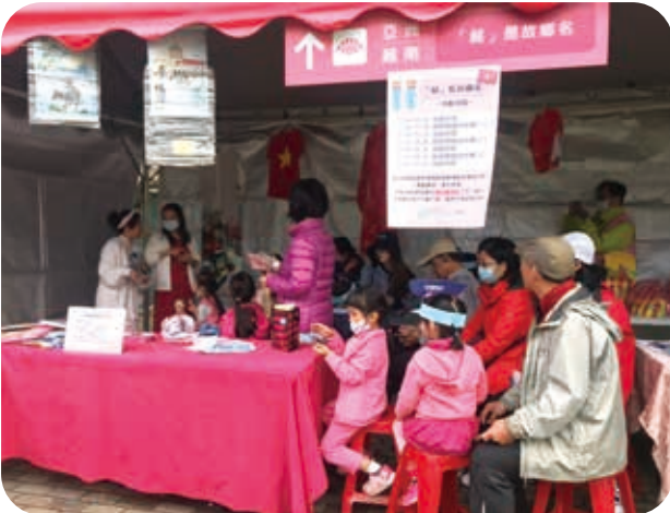
12/5於國立台灣圖書館「台灣閱讀節」設攤宣導越南文化。