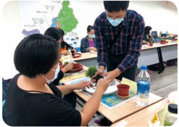
11/28「身心有愛綠無礙」活動，協助身障者參與園藝治療團體。