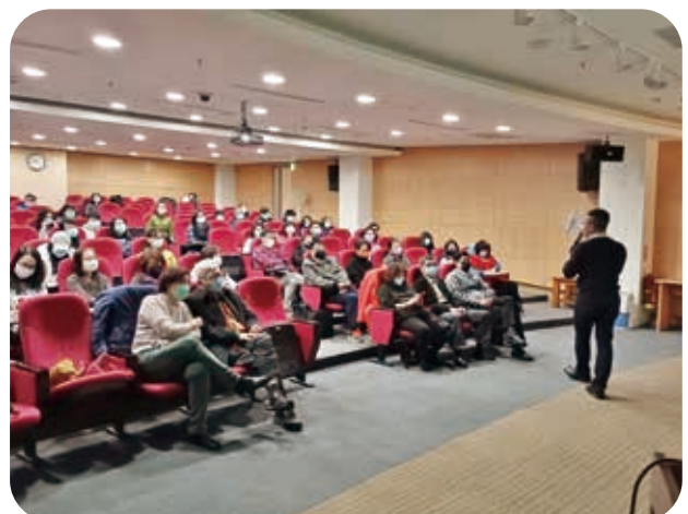
1/9協助台家盟辦理「通往未來的大學之道 - 大學考招新制」講座。