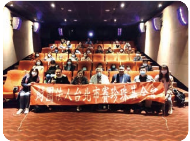
12/12由就諦學堂贊助辦理公益電影院 - 十二夜2。