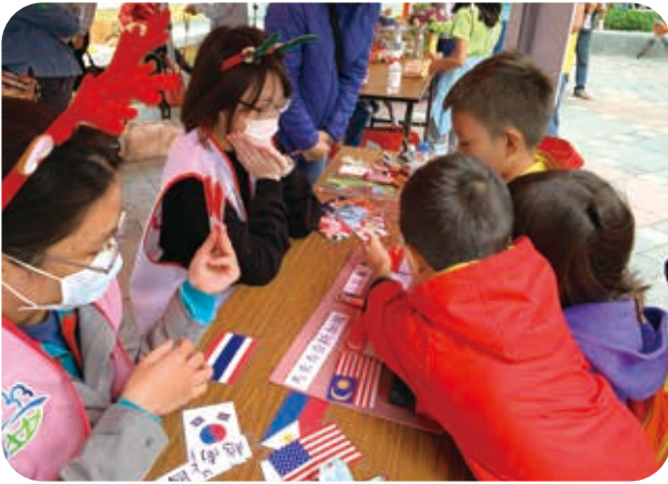
11/28聖誕嘉年華士林歡樂列車，透過國旗及國家特色的配對遊戲讓參與民眾認識異國文化。