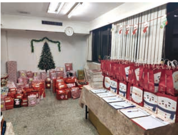
本會與美國學校扶幼社共同準備聖誕禮物，佈置充滿聖誕氣氛。

本次活動沿襲往例，社工事先調查每個孩子的願望，準備好願望清單後，再交由台北美國學校扶幼社的同學們準備和選購禮物，並改為在本會發放禮物。非常感謝台北美國學校扶幼社師生們的付出，共同合作將每份獨一無二的聖誕禮物送到孩子們的手中，體現聖誕節「給予(Give)」的精神。