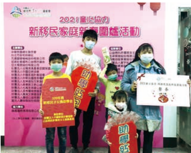
本會家庭開心領取圍爐餐券、助學紅包、獎助學金。