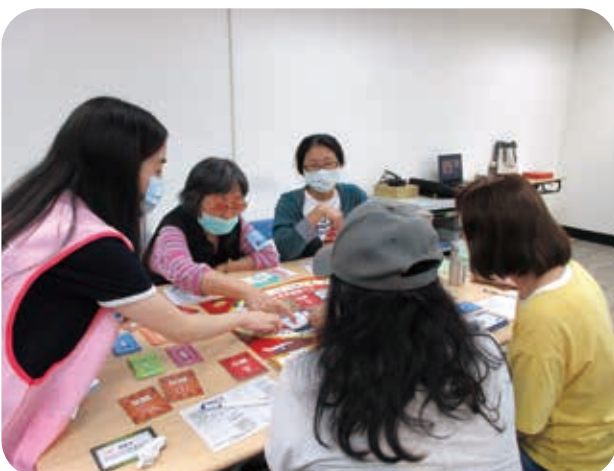
12/18「女子理財新人生」，中高齡婦女透過桌遊學習理財。