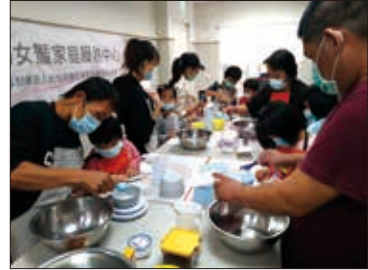
親子一同開心做料理。

今年期待更多元的親子活動，讓父母親及孩子能夠透過活動參與，發現、覺察彼此的優勢與正向互動經驗。